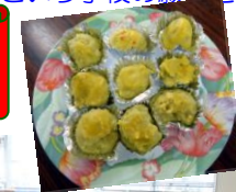
さつまいもの スイートポテト